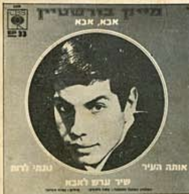
7 אי - פי 6238 אבא, אבא (מושר בעברית) 4 Hits Song by Mike Burstein