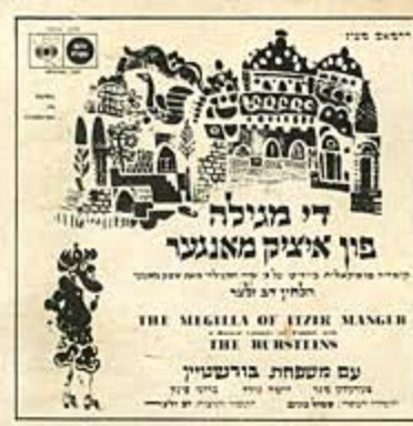
12 - 70011 די מגילה פון איציק מאנגער מושר באידיש / משפחת בורשטיין The Megilla of Itzik Manger (Yiddish)