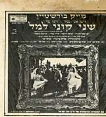
12 - 70017 שני קוני למל / פסיקול המקורי מושר בעברית Two Kuni Lemel (Hebrew)