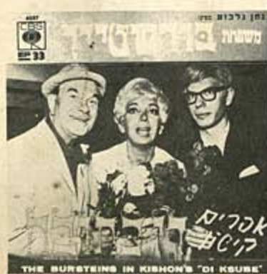
7 אי - פי 6237 די כחובה / מאת אפרים קישון מושר באידיש / משפחת בורשטיין "Di Kshub" by E. Kishon (Yiddish)